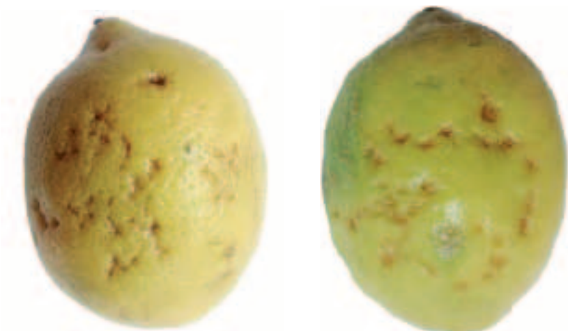
Figuras 1 y 2. Síntomas típicos de daño por frío en limón almacenado

En el segundo ensayo, cuya cosecha fue realizada con mayor cuidado y teniendo en cuenta los defectos del primer ensayo, tampoco se observaron daños de