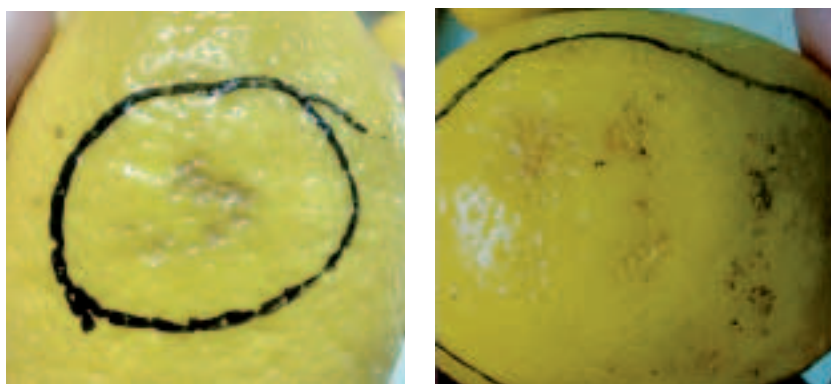
Figuras 3 y 4. Síntomas de daños mecánicos observados en frutos de limón acentuados por el tratamiento de frío a 2°C, EEAOC, 2015